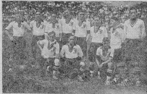
EL EQUIPO CUBANO FORTUNA

Muy buenos lances observamos, Gobán en su manera tan admirable de defender sale golpeado, después